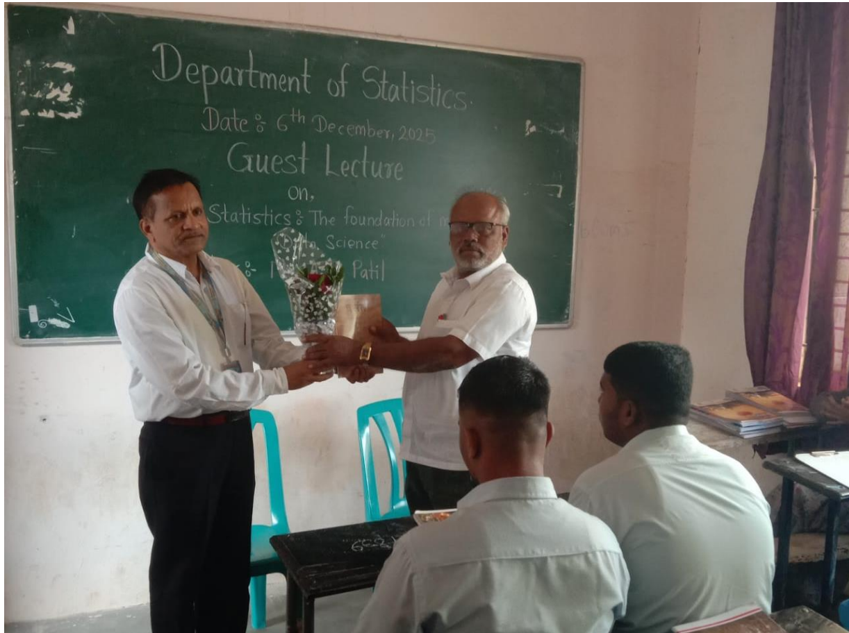
Welcome of Guest